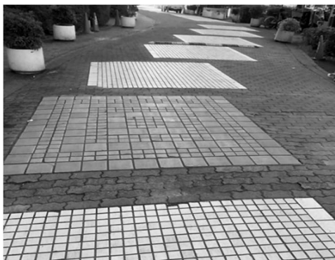
写真2. 道路Ⅱのタイル張り