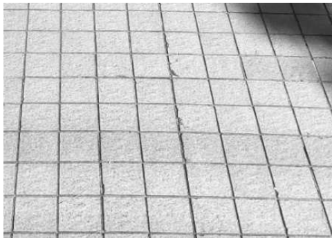
写真3. タイルの欠け（車輻荷重が原因と推定）

タイル張り箇所は歩車共存型道路であり、タイル張りした部分を通過する駐車場は50台分ある。単純計算で車輻が一日一回通過すると、タイル張り箇所は少なくとも33年間で 365 \times 33 \times 50 台=602,250回以上は車輻通過したと推定される。タイル張り箇所の詳細な施工データは確認できていないが、タイル張りの損傷は少ない。張付材の充填不足箇所に車輻荷重が加わったことによると推定されるタイル欠け（写真3）を確認できた程度である。