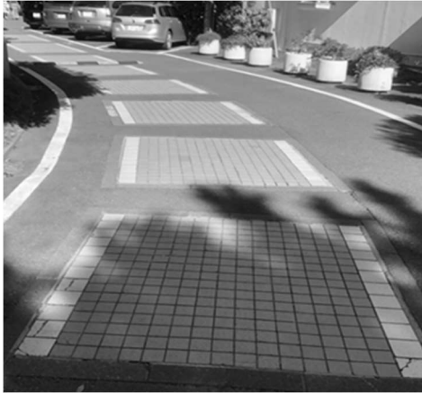
写真1. 道路Ⅰのタイル張り