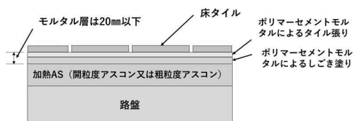
図1. 加熱AS下地のタイル張り施工断面の例

アスファルト合材は、「加熱アスファルト合材（以下、加熱AS）」と「常温AS」に大別され、加熱ASを下地とするタイル張り工法は約35年前に道路会社やタイルメーカーなどで研究開発が行われ、特殊な工法として使用 2) されてきた。その施工断面を図1に示す。